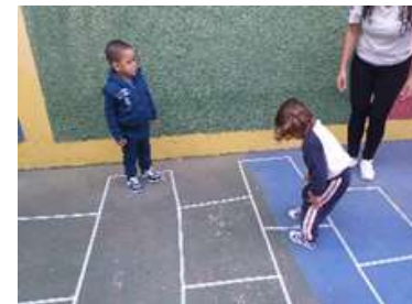
Pesquisa com as famílias sobre brincadeiras típicas (Amarelinha, foi a brincadeira mais conhecida pelas famílias)