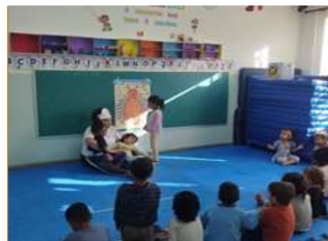
Painel do Alfabeto