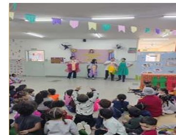
Teatro – Elefante Colorido