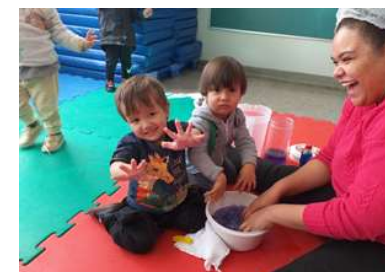
Explorando novas texturas

Sede: ALAMEDA DA CRIANÇA, 105 VILA VITÓRIA – (19) 3875-4598