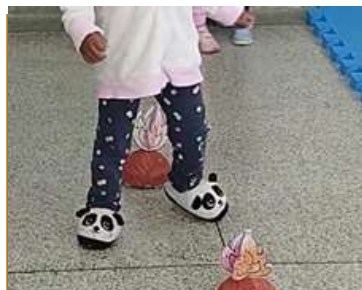
Brincadeira típica Junina – Pula fogueira