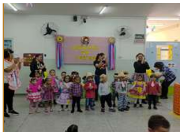
Apresentação da Festa Junina