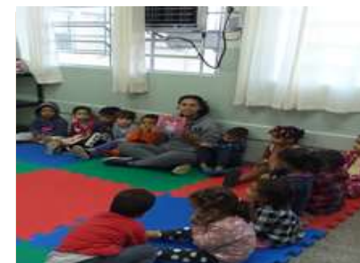
Contação de História – A pinta fujona

Sede: ALAMEDA DA CRIANÇA, 105 VILA VITÓRIA – (19) 3875-4598