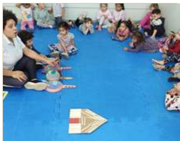
Produção textual: Os três porquinhos