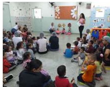
Apresentação de Teatro