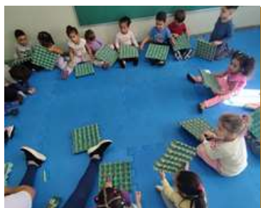
Pareamento das cores