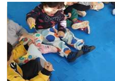
Brincadeira – Passa o Papel

Sede: – ALAMEDA DA CRINÇA, 105 – VILA VITÓRIA (19) 3875-4598