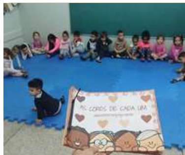
Leitura da historia: “As cores de cada um”.