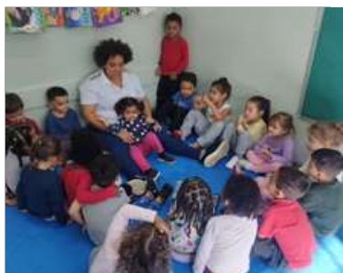
Bate – Papo “ O que fez no fim de semana?”