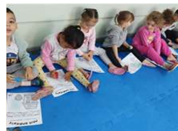
Dia do Meio Ambiente – Explorando folhas de árvores.