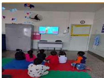
Vídeo cuidados e carinhos com si e com o outro