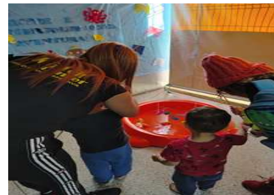
Pescaria com a Família