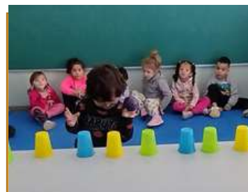
Brincadeira – Acerte o Alvo