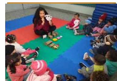
Produção textual – Cachinhos dourado