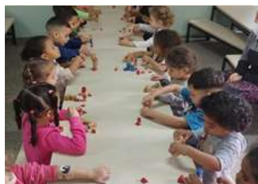
Brincando com blocos de engenheiros