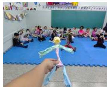
Confecção de bonecas de papel – representando cada criança