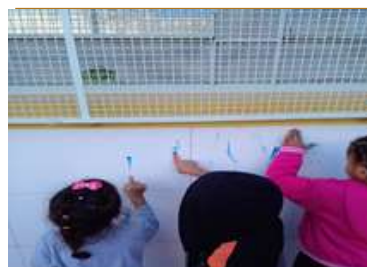
Escrita Espontânea – Letra I