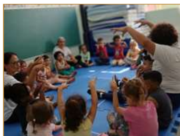
Musicalização para estimular a fala e a linguagem