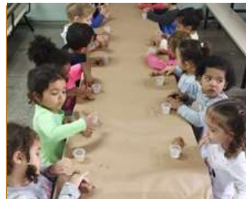
Argila – Expressando livremente a criatividade